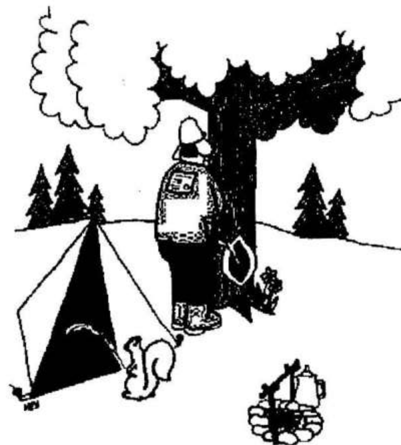
The Balance of Nature